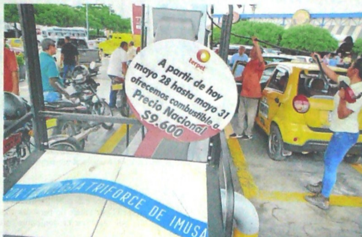
SEGÚN EL GREMIO, el aumento en la demanda se debe a que el porcentaje de tanqueo de pimpinas en la calle se pasó a las estaciones de servicio.

Agregó que desde el 17 de mayo también se había autorizado la movilización de