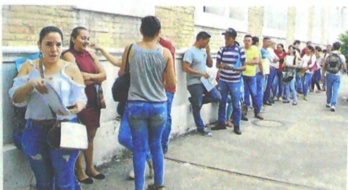
EL RANKING tiene en cuenta una amplia variedad de estadísticas como el desempleo, el PIB y el gasto gubernamental en salud y educación.

El podio del listado tuvo dos variaciones, ya que Estados Unidos fue destronado por Singapur, Hong Kong se