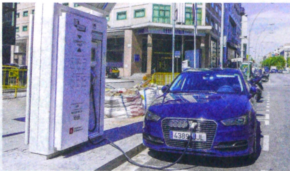
En unos años, las ciudades de Colombia deberán tener un mínimo de lugares de carga.

Y agregó que Colombia, el año pasado, quedó de número uno en ventas de vehículos eléctricos en la región, pero aún tiene un défi-