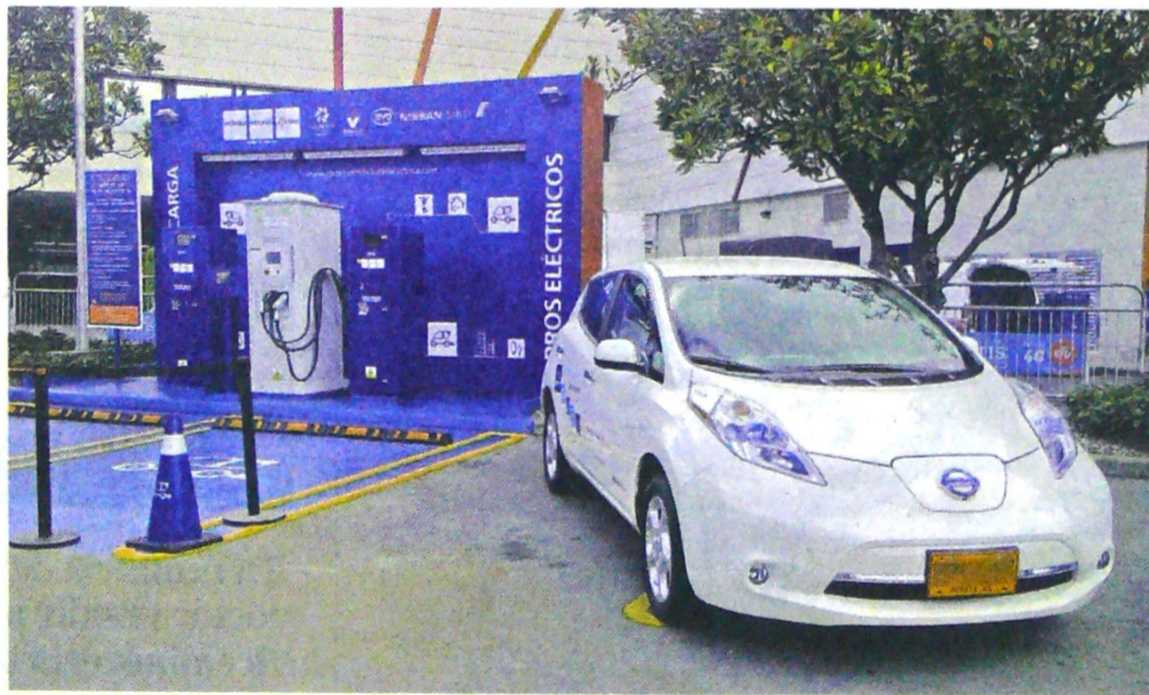
El impuesto será de 1%, mientras que los otros carros tienen una tarifa de entre 1,5% y 3,5% del valor comercial.

El Congreso aprobó una ley que les baja los impuestos y los libera de pico y placa. A mediano plazo, las ciudades deberán tener más puntos de carga. Pág. 7