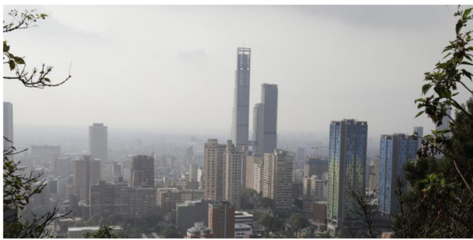
El 80 por ciento de la contaminación del aire que se respira en Colombia proviene de fuentes móviles.

RELACIONADOS: MEDIO AMBIENTE | CONTAMINACIÓN DEL AIRE | SENADO | LEY