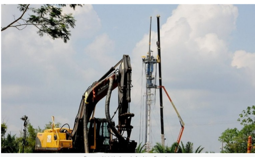
Ecopetrol inició piloto de fracking.

Esta práctica generaría alrededor de 100 mil puestos de trabajo