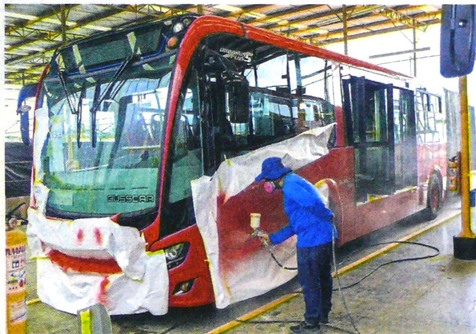
La entrega de buses se realizará durante todo el año, hasta completar la flota en el 2020. TM

Cada bus posee motor a gas natural Euro VI, marca Scania, de 9.300 centímetros cúbicos, cinco cilindros y una potencia máxima de 340 caballos de fuerza (HP) y una energía de 253,3 kilovatios (Kw). Además tiene una capacidad de hasta 250 pasajeros, el equivalente a 125 vehículos. ☺