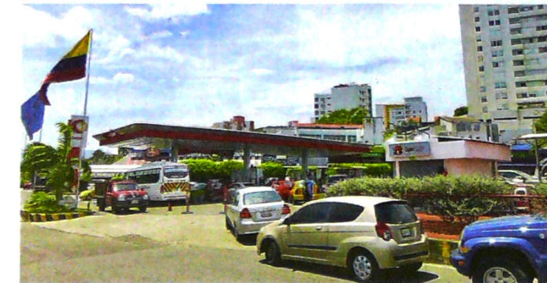
Desde el 2015, las estaciones de servicio de Cúcuta no experimentaban un repunte en ventas de estas dimensiones, que se evidencia en las largas filas de vehículos para tanquear.

Desde el cierre de la frontera de 2015, las 37 estaciones de servicio de Cúcuta y su área metropolitana no experimentaban un repunte en ventas de estas di-