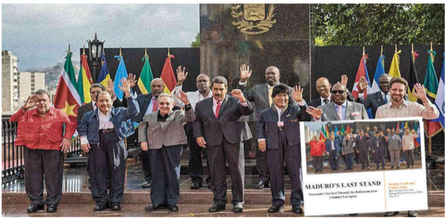
La investigación afirma que Maduro y sus gobiernos aliados se han enriquecido al desviar los millones del petróleo y el oro venezolanos.

Una investigación de la National Defense University revela los mecanismos usados por el gobierno venezolano para desviar miles de millones. En ellos participarían grupos criminales colombianos y otros gobiernos continentales.