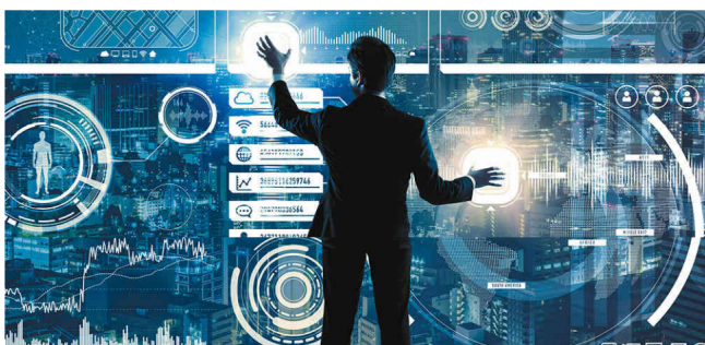
Las 100 empresas más grandes de Colombia (...y las 900 siguientes)

En un año de altibajos en la política y la economía, el petróleo fue el gran impulsor de los resultados empresariales. El país volvió por la senda del crecimiento, aunque este todavía luce débil. Por eso se requieren señales claras que consoliden los resultados.