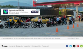
En las estaciones de servicio del área metropolitana de Cúcuta no usan las calas para tanques.

Mirambón le permitió a Ecopetrol el descargue de un buque con 140.000 barriles de gasolina, en Barranquilla, con destino principal hacia Norte de Santander.