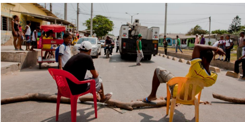
Los hurtos de cable han provocado 50 horas de cortes. Hay pueblos donde van 30 protestas.

Problemas de Electricaribe, pese a su intervención, preocupan a dirigentes y gremios de la región.