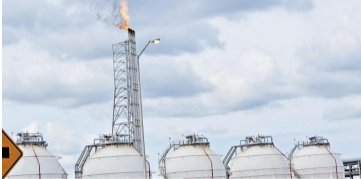
El Congreso tiene la palabra.

REDACCIÓN VEHÍCULOS @ 01:34 PM, 24 DE MAYO DEL 2019