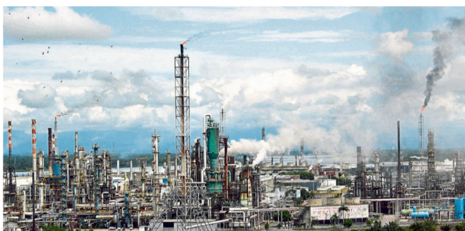
El Congreso de la República, a más tardar en dos años, debe establecer la nueva forma del cálculo del precio del galón de gasolina.

RELACIONADOS: ECONOMÍA | UNIVERSIDAD DE ANTIOQUIA | CORTE CONSTITUCIONAL | COMBUSTIBLES