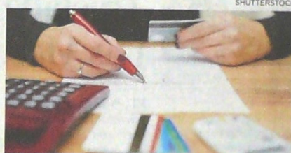
Ley busca darle oportunidad a los morosos.