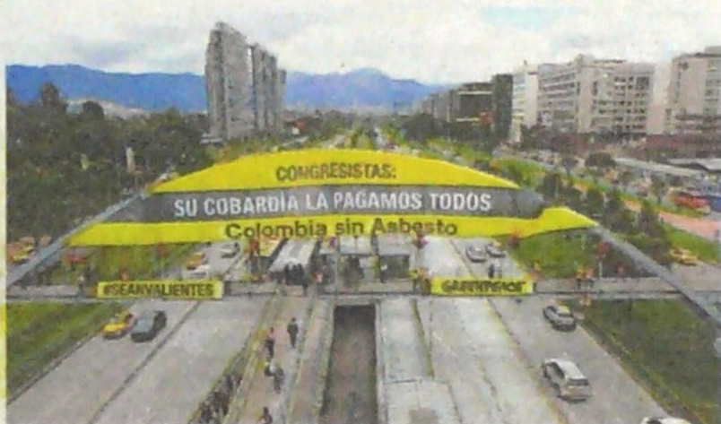
Ambientalistas han insistido en la prohibición en el país.

BOGOTÁ. El proyecto que busca prohibir la producción, comercialización y distribución del asbesto fue aprobado en la Comisión Séptima, en el tercero de cuatro debates.