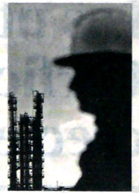
Los contratos ascienden a US$1.170 millones.

"Dicho esto, persisten esas y otras fuentes de incertidumbre", indica el documento. Miembros de la Fed aún esperan que el país crezca sólidamente este año, pero por debajo del ritmo del primer trimestre cuando la economía se expandió 3,2%. No obstante, el sector agrícola enfrenta dificultades debido a los problemas comerciales con China.