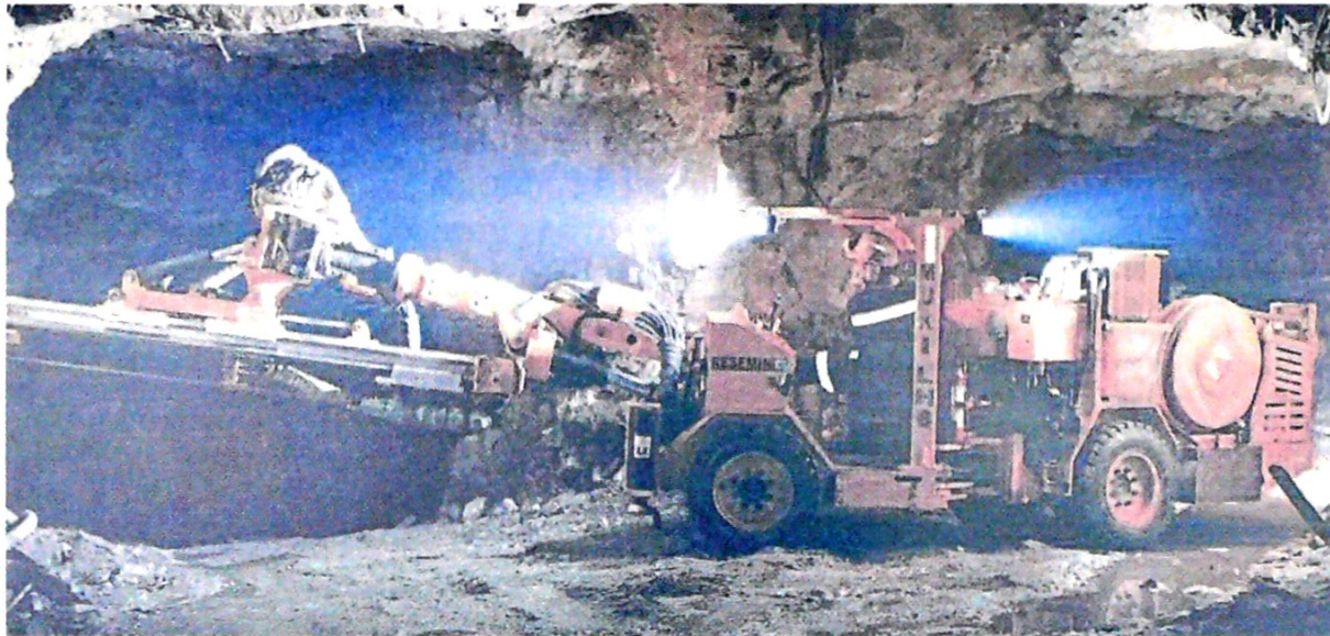
El oro se ubicó como el segundo mineral en importancia en cuanto a sus aportes por concepto de regalías, después del carbón.