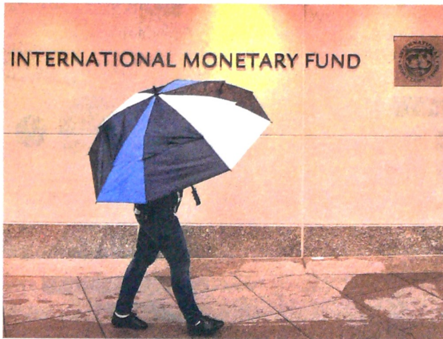
El FMI prevé que el PIB de Colombia aumente 3,6%, en la misma línea que el Gobierno.

“las autoridades (locales) continúan dando al acuerdo LCF un carácter precautorio y han tomado medidas proactivas para prepararse para una eliminación gradual, si los riesgos lo permiten, de la LCF en línea con el carácter temporal del instrumento”.