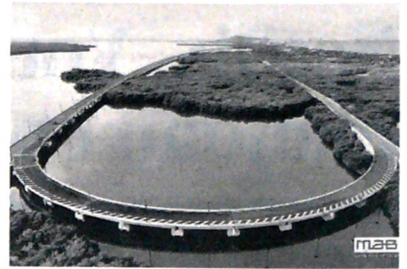
Vía de entre Cartagena y Barranquilla

La dependencia que Colombia tiene de los precios del petróleo sigue siendo una alerta externa, en tanto que, a nivel local, el FMI ve como riesgo la migración desde Venezuela (y su impacto fiscal), para lo cual aseguró que, de no incrementar los ingresos tributarios, el país tendría que hacer recortes grandes en el gasto social, “lo cual afectaría el crecimiento y la reducción de la pobreza”.