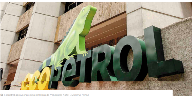
© Ecopetrol aprovecha caída petrolera de Venezuela Foto: Guillermo Torres

Mayor demanda en ese país, mejor desempeño de la Refinería de Cartagena y aumento de la producción impulsaron el crecimiento de las ventas externas de la principal empresa colombiana. Cabe recordar que hoy Colombia produce más petróleo que Venezuela, por cuenta de la crisis del sector petrolero en ese país.