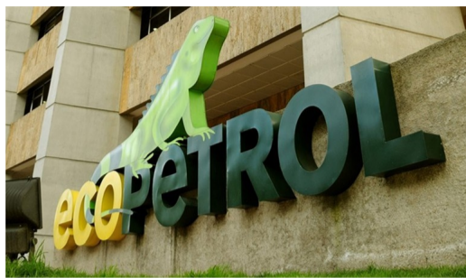
Ecopetrol ve en el fracking la oportunidad de triplicar reservas de gas y petróleo.

Dentro de su plan de desarrollo para el fracking en Colombia, Ecopetrol confirmó que en los siguientes dos años, tendrá 500 millones de dólares en inversión.