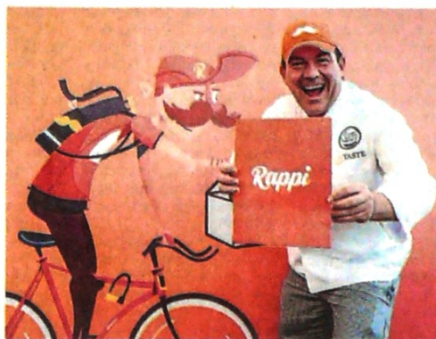
Según SoftBank, Rappi es una de las firmas de base tecnológica de mayor crecimiento en América Latina.