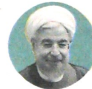
HASAN ROHANI presidente de Irán

de Irán con las mismas centrifugadoras es capaz de aumentar su producción y con las medidas que llevan a cabo los expertos de la industria nuclear no pasará mucho tiempo antes de que superemos el límite de producción de 300 kilos”, subrayó. Conforme al lla-