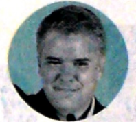
César Gaviria, jefe del Partido Liberal.

Con el caso de 'Santrich' y los cuestionamientos al Ejército, el Presidente dijo que no tolerará la violación de la Constitución y la ley en las Fuerzas Armadas.