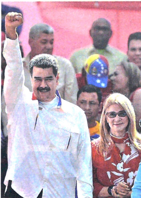
El presidente Nicolás Maduro, acompañado de la primera dama, Cilia Flores.

Minutos antes de la declaración presidencial, la oficialista Asamblea Nacional Constituyente (ANC) aprobó por unanimidad extender su periodo de funcionamiento por año y medio más, hasta el 31 de diciembre del 2020. El presidente de la ANC, Diosdado Cabello, el segundo hombre fuerte del gobierno venezolano, dijo que extendían sus labores "para seguir cum-