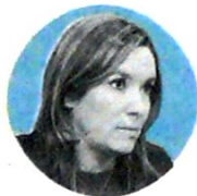
MARÍA FDA. SUÁREZ Ministra de Minas y Energía

Para el sector, los generadores así podrían gestionar coberturas cambiarias de manera más eficiente. "Mantener la moneda del mecanismo en pesos no es una barrera para la participación de múltiples proyectos por parte de la oferta", subraya la misiva. ☺