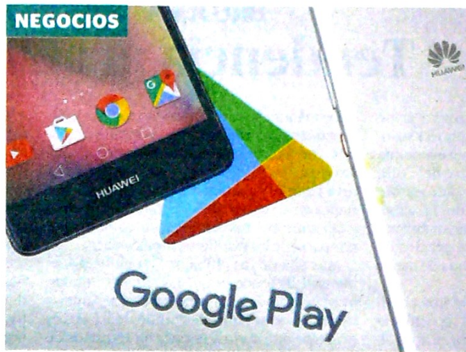
La compañía china debe desarrollar un nuevo sistema operativo.

Según la Unidad de Planeación Minero Energética (Upme) , como van las cosas, en 10 años no habría con qué cargar las refinerías. Pág. 8