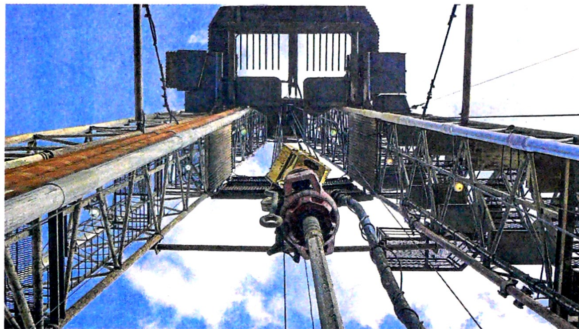
La Upme propone cambios en los contratos de exploración para asegurar una producción mínima de 900.000 bpd.

A renglón seguido, el texto resalta que, como los resultados en términos de incorporación de reservas “no están rindiendo los frutos esperados”, es de esperarse que la construcción de los escenarios de producción de petróleo a mediano y largo plazo con base en las reservas probadas, proba-