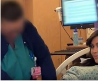
9 reglas que las enfermeras debían seguir durante los nacimientos de Kardashian