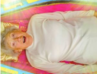
¿Por qué los clubes de ataúdes están de moda en Nueva Zelanda?