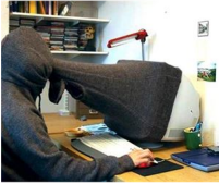
5 invenciones absurdas que definitivamente podemos vivir sin