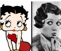
La vida real Betty Boop que demandó al dibujante que la hizo famosa