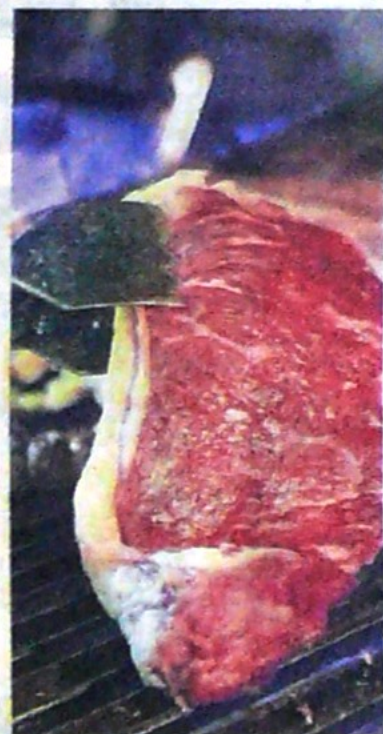
Prohibición peruana incluye carne vacuna y porcina.

El documento precisó que “las autoridades peruanas podrán autorizar el ingreso excepcional de los productos prohibidos siempre que el riesgo sea bajo y cumplan todos los requisitos establecidos por el Servicio Nacional de Sanidad y Calidad Agroalimentaria (Senasa)”. La prohibición ampliada por Perú se podrá reducir o prorrogar en fun-