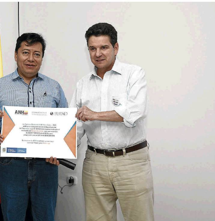
Pierre Ancines / LR