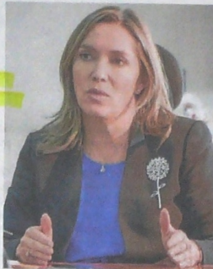
María Fernanda Suárez, ministra de Minas y Energía.

Eso es muy importante dejarlo claro. Para iniciar la fase de explotación debemos surtir la de exploración. La Comisión recomienda total transparencia del proceso. Dar a conocer de manera pública cómo se realizarán los pilotos, cuál será la profundidad de los pozos, la distancia de los acuíferos, los impactos de sismicidad y demás información, lo que permitirá la veeduría ciudadana. Solo cuando se surta esto se podría pasar a la siguiente fase de explotación y comercialización.