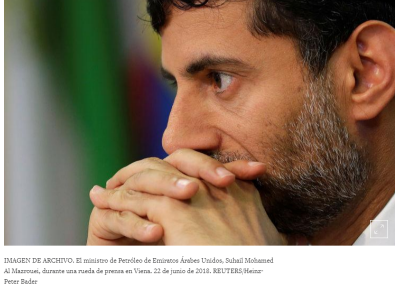
IMAGEN DE ARCHIVO. El ministro de Petróleo de Emiratos Árabes Unidos, Suhail Mohamed Al Mazrouei, durante una rueda de prensa en Viena, 22 de junio de 2018.

YEDA, Arabia Saudita, 18 mayo (Reuters) - El ministro de Energía de Emiratos Árabes Unidos, Suhail al-Mazrouei, dijo el sábado que los inventarios mundiales de petróleo todavía se están acumulando, particularmente en Estados Unidos, y que la labor de la OPEP y sus aliados para equilibrar el mercado aún no termina.