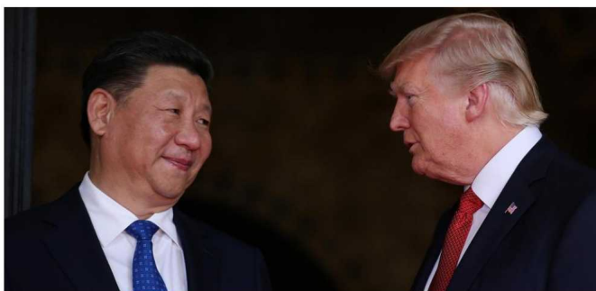
El presidente chino Xi Jinping, con Donald Trump.