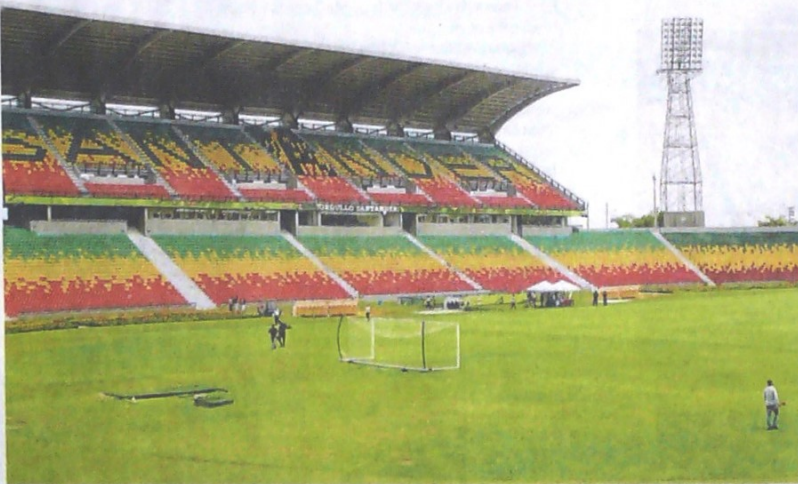
Marcos Valencia / VANGUARDIA

Bucaramanga sueña con el Preolímpico Sub 23