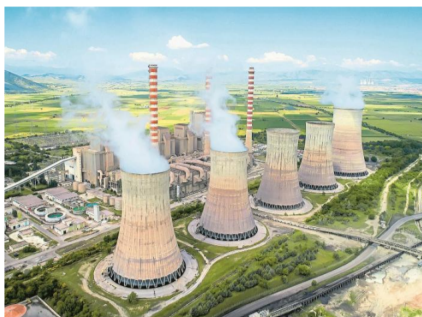
Tras décadas desde su implementación, la energía nuclear no ha logrado cumplir con todas las expectativas que se habían puesto en ella.