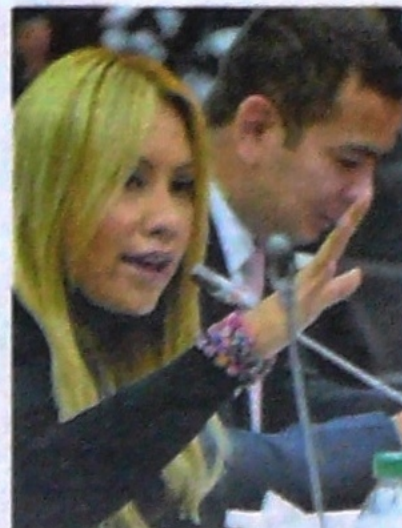
La senadora de la Alianza Verde Sandra Ortiz Nova fue la citante al debate en la Comisión Quinta.

Este tema se tocó en el reciente debate que se