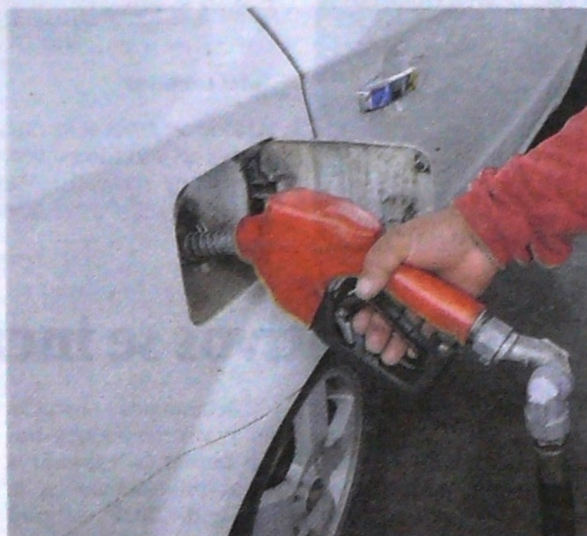
La Senadora invita a una 'pitatón' nacional mañana 17 de mayo al mediodía, para rechazar el costo y calidad de los combustibles.