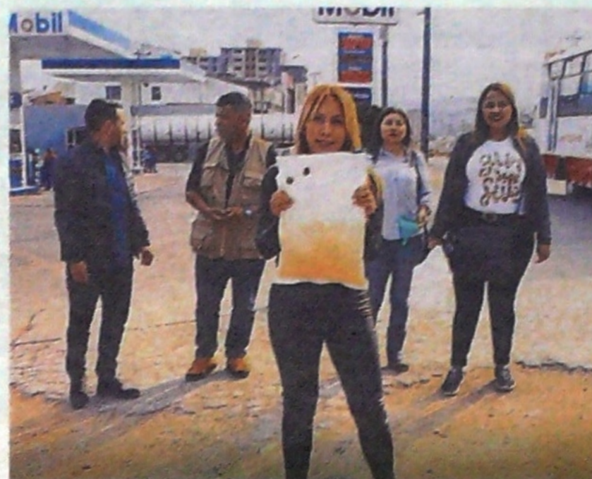
Fueron varios meses en los cuales el equipo de trabajo de la Congressista confrontaron la información con diferentes estudios.

Ante esta situación se pidió la intervención de las autoridades de la salud.