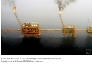
FOTO DE ARCHIVO: Vista de una plataforma de producción de petróleo en un campo del Golfo Pérsico, al sur de Teherán. REUTERS/Rahab Hossaini

* Los futuros del referencial Brent ganaron 85 centavos, o un 1,18%, a 72,62 dólares el barril, luego de tocar su mayor nivel en tres semanas. Los futuros del West Texas Intermediate de Estados Unidos (WTI) subieron 85 centavos, o un 1,37%, a 62,87 dólares el barril.