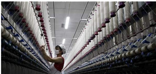
La industria, que había venido recuperándose, sorprendió con una baja de 6,2 %.

RELACIONADOS: EMPRESAS COLOMBIANAS | ECOPETROL | TERPEL