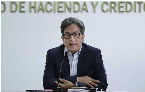
Ministro de Hacienda, Alberto Carrasquilla, ha dicho en repetidas oportunidades que el Gobierno estudia su participación en compañías.