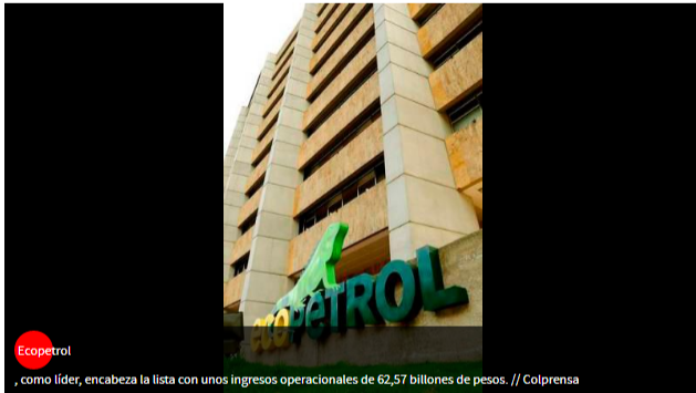
Ecopetrol, como líder, encabeza la lista con unos ingresos operacionales de 62,57 billones de pesos.

EL COLOMBIANO | @ElUniversalCtg | 15 de mayo de 2019 08:23 PM |