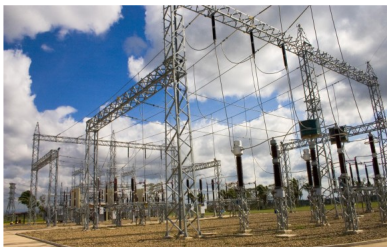
Al cierre de la jornada de ayer ISA fue la segunda acción más valorizada en 1,16 % a $15.720 pesos.