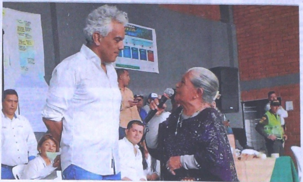
Mientras el Ministerio de Ambiente cumplía con la fase de consulta en California, la Procuraduría pidió a Minambiente y Anla someter a consejo consultivo proyecto de explotación de Minesa.

Además, sobre el componente social consideró