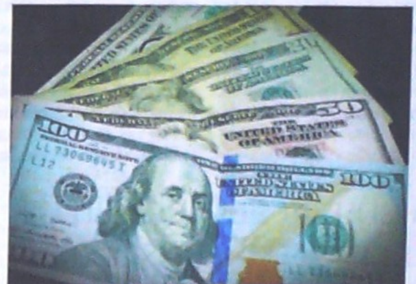
En el primer día de la semana, el dólar ganó $24,75, comportamiento impulsado por la guerra comercial entre EE.UU. y China.

cio de que China impondrá aranceles a productos estadounidenses, en respuesta a una medida similar de Washington, lastró sin embargo el precio durante la segunda parte de la jornada, ante la perspectiva de que una guerra comercial limite la demanda.