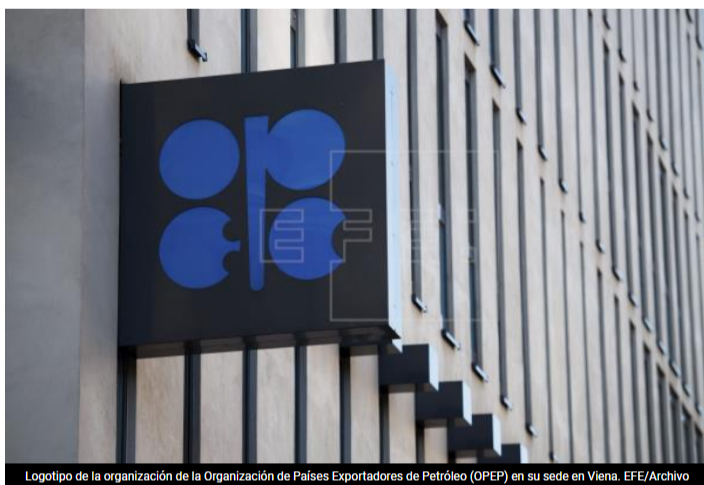
Logotipo de la organización de la Organización de Países Exportadores de Petróleo (OPEP) en su sede en Viena.