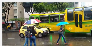
Santander en máxima alerta por el regreso de la temporada de lluvias