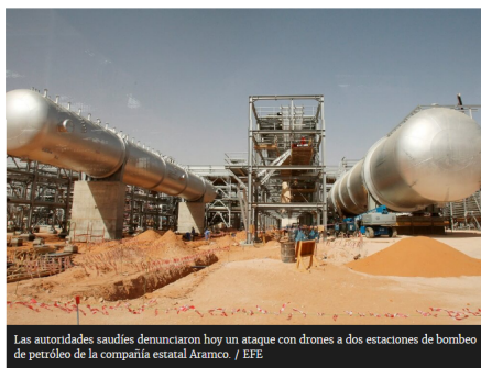
Las autoridades saudíes denunciaron hoy un ataque con drones a dos estaciones de bombeo de petróleo de la compañía estatal Aramco.

Los rebeldes hutíes de Yemen reivindicaron los hechos, en los que atacaron con siete aviones no tripulados instalaciones de Arabia Saudí como respuesta a la "agresión" contra el pueblo yemení, según informó hoy la televisión Al Masira, controlada por el movimiento.