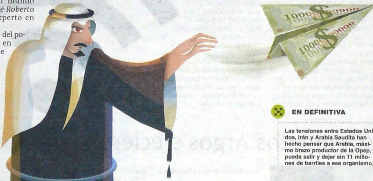
ILUSTRACIÓN ELENA OSPINA

Al fenómeno se suma el hecho de que el domingo pasado fueron atacados cuatro buques que cargarían petróleo saudí para clientes de Estados Unidos. Lo que aumentó las especulaciones sobre si Arabia preferirá ser autosuficiente y no usar ni la seguridad, ni la infraestructura de la Opep ■