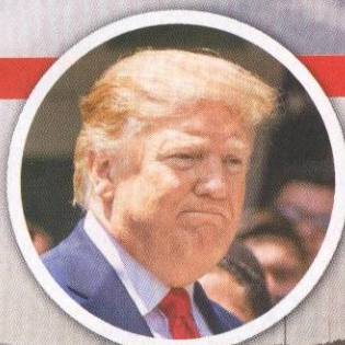
▲ Donald Trump, presidente de Estados Unidos