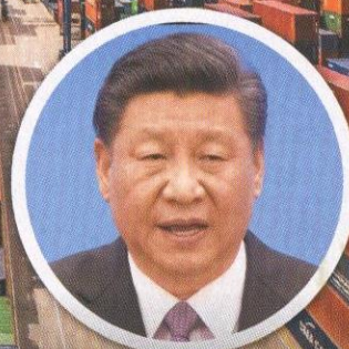
▲ Xi Jinping, presidente de China