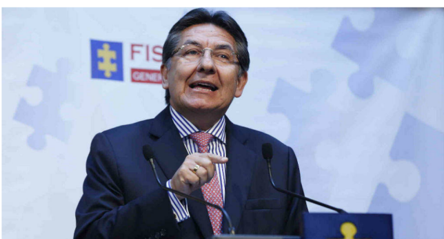
El fiscal presentó su preocupación porque el caso prescriba.

En una carta que hizo llegar al presidente del Consejo Superior de la Judicatura, Néstor Humberto Martínez expresó su preocupación porque el caso prescriba. Martínez denunció maniobras para dilatar el proceso pues hasta la fecha, la audiencia de acusación que inició en noviembre de 2017 todavía no ha concluido.