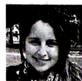
LILIAN MARIÑO ESPINOSA Enviada especial*

SEATTLE El acuerdo que logró iNNpulsa con 500 Startups , una de las principales aceleradoras de Silicon Valley , que lo que busca es impulsar o escalar emprendimientos, no es la primera alianza que hará la institución del Gobierno, ya que en los próximos meses espera que se materialicen diálogos que se adelantaron con Y Combinator , una de las más importantes en la industria mundial y donde Rappi consiguió la primera capitalización para acelerar su crecimiento.