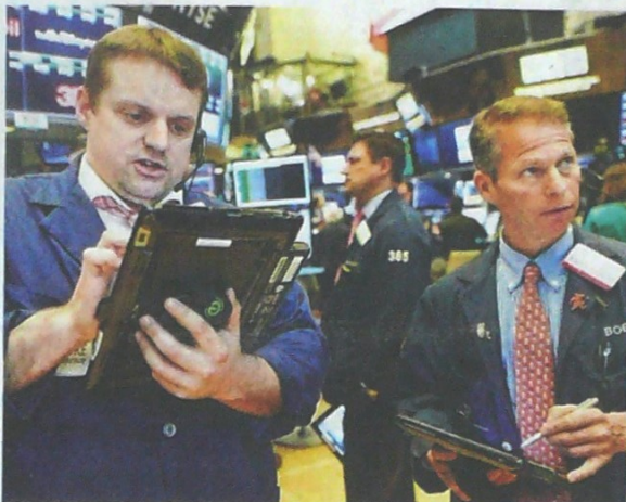
Los mercados internacionales terminan una semana llena de incertidumbre que ha llevado a que las bolsas tengan constantes pérdidas.

tización de la moneda estadounidense podría bajar en unos meses.