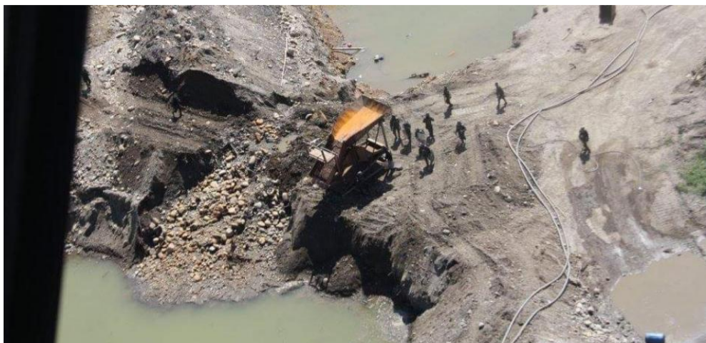
El Presidente Iván Duque dijo que van a crear un grupo especial con la misión específica de luchar contra los carteles de la minería ilegal en el país.

RELACIONADOS: MINERÍA ILEGAL MINERÍA ILEGALIDAD IVÁN DUQUE